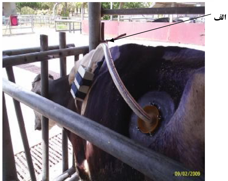
شکل ۱- بخش‌های مختلف سیستم سیار ثبت پیوسته pH شکمبه: الف) سیستم سیار روی بدن گاو؛ ب) الکترود pH متر همراه با اتصالات؛ ج) رابط اتصال وزنه به الکترود؛ د) وزنه استیل؛ ه) الکترود pH متر؛ و) شیلنگ محافظ کابل الکترود؛ ز) دستگاه ثبت داده؛ ح) جعبه محافظ دستگاه ثبت داده؛ ط) کمر بند.